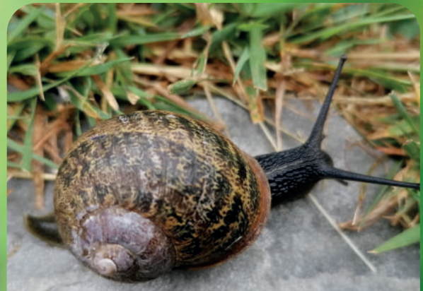
Schnecke im Haus