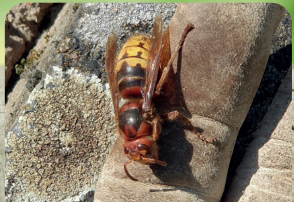
Hornisse auf Handschuh