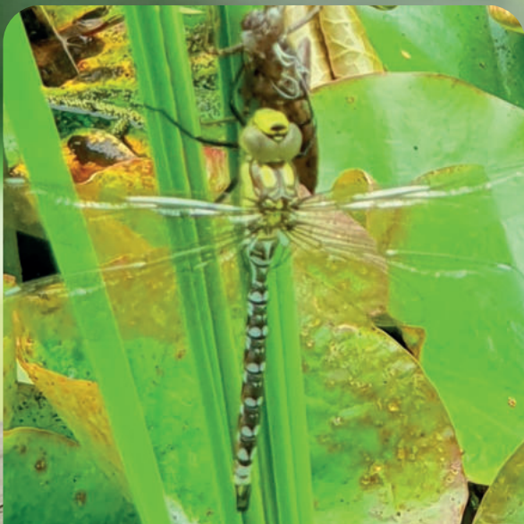
Libelle schlüpft aus