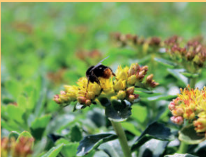
Auch bei Insekten beliebt: Fetthennen (Sedum) brauchen wenig Wasser, sind ausgesprochen pflegeleicht und bilden attraktive Blüten.